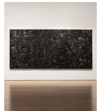
Issu du feu , 2000. Charbon sur toile, 210 x 440 cm.