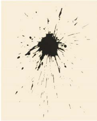
Sans titre, 2016. Médium acrylique, noir de charbon sur toile, 162 x 130 cm.