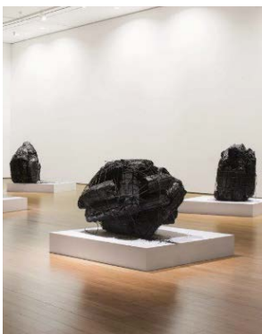
Issu du feu , 2000. Charbon de bois et fil élastique, mesures variables.