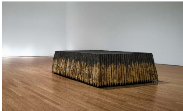
Landscape , piquets de bois brûlés, 360 x 240 x 80 cm.