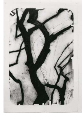
Drawing, 1997. Fusain sur papier, 145 x 114 cm.

Les formes noires, les matériaux, les fonds blancs, la lumière et l'ombre, la densité et la transparence sont un vocabulaire que l'artiste utilise depuis le début de sa carrière pour révéler un environnement et un paysage intérieur où les formes, l'espace et les éléments sont l'expression philosophique, poétique d'une relation au monde. Entre formes et matériaux, temporalité et surgissement du geste, d'une attitude entre corps et nature, tout dans l'œuvre de Lee Bae est l'expression de la vitalité, de la force et de l'énergie.