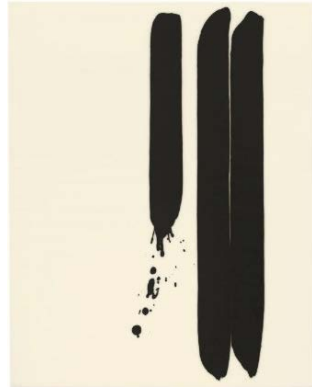
Sans titre, 2011. Médium acrylique, noir de charbon sur toile, 162 x 130 cm.