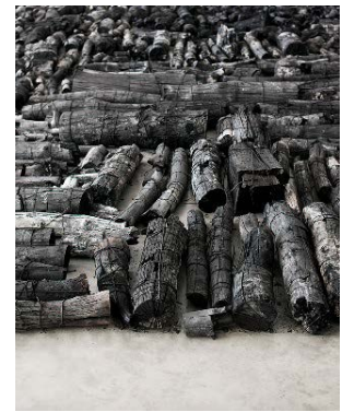
Landscape , troncs d'arbres brûlés, 18 x 16 m (détail).

Sous le commissariat du critique d'art Henri-François Debailleux, cette exposition met en lumière une œuvre construite autour de mélanges très subtils hérités d'un art abstrait occidental comme de l'arte povera, avec les codes et les pratiques artistiques traditionnels de la culture coréenne. Ainsi chez Lee Bae, l'idée de nature est présente à la fois grâce au feu, au charbon de bois mais également grâce à la symbolique et à l'immatériel du noir. L'artiste aime rappeler que les bois brûlés, le charbon dont il se sert, naissent de la main de l'homme et de sa capacité à transformer cette matière naturelle.