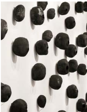
Issu du feu , 1998. Charbon sculpté, 30 cm de diamètre.

Au printemps, du 24 mars au 17 juin, l'artiste coréen Lee Bae investira la Fondation Maeght pour y présenter des peintures, des sculptures et des installations épurées, spécialement conçues pour l'espace architectural et la lumière de la fondation.