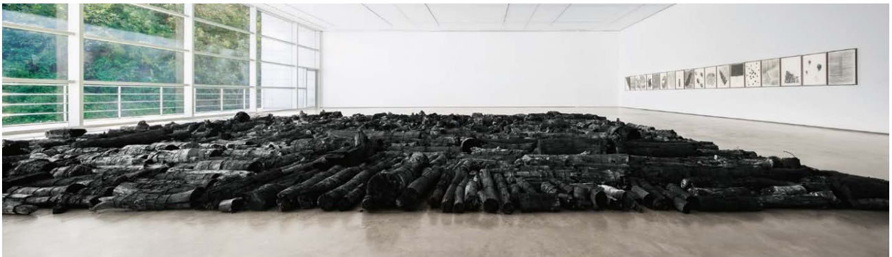
Vue de l'exposition Lee Bae, The streams rise in the firmament en 2014 au Daegu Art Museum. Landscape , troncs d'arbres brûlés, 18 x 16 m.

Les formes noires, les matériaux, les fonds blancs, la lumière et l'ombre, la densité et la transparence sont un vocabulaire que l'artiste utilise depuis le début de sa carrière pour révéler un environnement et un paysage intérieur où les formes, l'espace et les éléments sont l'expression philosophique, poétique d'une relation au monde. Entre formes et matériaux, temporalité et surgissement du geste, d'une attitude entre corps et nature, tout dans l'œuvre de Lee Bae est l'expression de la vitalité, de la force et de l'énergie.