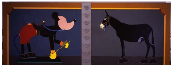
La Guerra de dos mundos, 2002.

Eduardo Arroyo utilise l'imagerie médiatique, la photographie publicitaire, le cinéma américain ou les films noirs, comme il en est pour Blanco White , personnage vide, observé par les espions, ou, encore pour les acteurs de la série Toute la ville en parle réalisée dans les années 1980 et inspirée du film éponyme de John Ford de 1935.