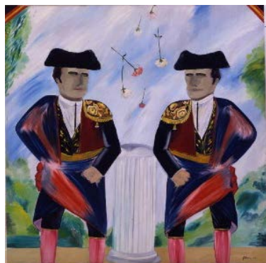
Double portrait de Bocanegra ou le jeu des 7 erreurs, 1964.

Du 1 er juillet au 19 novembre 2017, le peintre figuratif espagnol Eduardo Arroyo investira les cimaises de la Fondation Maeght avec une ironie qui se joue des scénographies mythologiques ou politiques. Considéré comme l'un des grands peintres espagnols de sa génération, Eduardo Arroyo peint l'humanité à travers des jeux d'images dont l'origine est tant la société que l'Histoire, l'histoire de l'art ou de la littérature. Egalement écrivain, il utilise la narration par fragment, avec humour et goût du paradoxe, et livre une œuvre picturale extrêmement construite et faisant preuve d'une liberté constante. Le titre de l'exposition que propose la Fondation Maeght, « Dans le respect des traditions », indique ce parti pris, entre l'absurde et l'ironie.