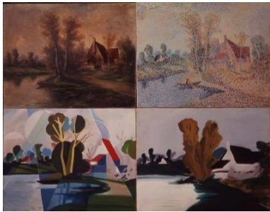
Dans le respect des traditions, 1965.

« La peinture est en quelque sorte littéraire ; et c'est dans ce sens que je travaille sur des thèmes. Il y a un début, une fin, des personnages, et l'ambiguïté propre aux romans. C'est donc un récit, comme si j'avais écrit une quinzaine de romans... », explique Eduardo Arroyo.