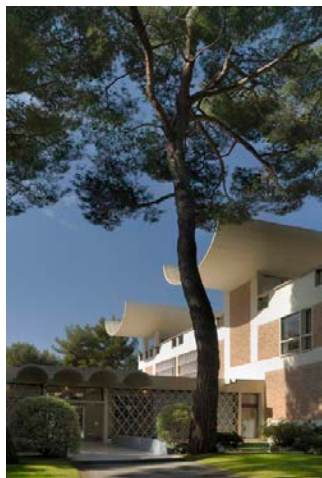
Les jardins de la Fondation Maeght.