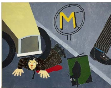
Arthur Quiller-Couch dit Q.What odds?, 2016.

La Fondation Maeght proposera un parcours thématique d'œuvres réalisées depuis 1964 et composé de tableaux célèbres comme de peintures inédites, dont une série de toiles réalisées spécialement pour cette exposition. Elle présentera de nombreux dessins et un ensemble de sculptures, dont des pierres modelées et des assemblages, entre fiction et réalité, comme cette série de têtes hybrides de Dante-Cyrano de Bergerac, ou de Tolstol-Bécassine. Spectaculaire par sa diversité de matières, par la profusion de personnages, par son éventail de couleurs, l'accrochage mettra en scène des petits théâtres comme celui autour du tableau l'Agneau Mystique de Hubert et Jan Van Eyck, ou celui rassemblant des « vanités », des crânes et des mouches dans la Cour Miró.